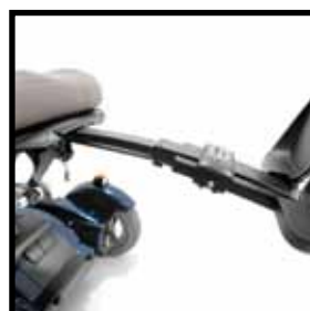
Natürlich geschwungene Beinstützen