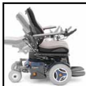
175° elektrische Rückenlehnenverstellung