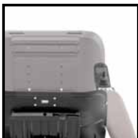
Geteilte Rückenlehne in 25mm –Schritten einstellbar

Der neue Corpus 3G ist stilvoll und schnittig und bietet dennoch denselben Komfort und das Gefühl wie sein Vorgängermodell.