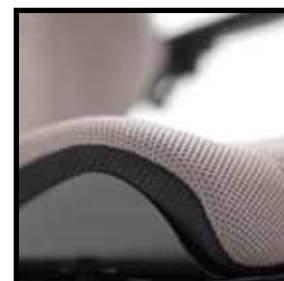
Hautschutz und Positionierungssysteme