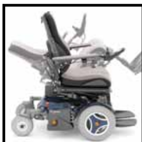
50° Kantelung mit 2 Auswahlbereichen