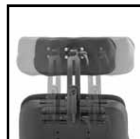
Uni- Track-Schiene an der oberen Rückenlehne