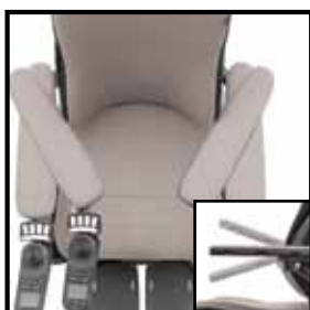
Multifunktionale Armlehnen in einer freitragenden Konstruktion